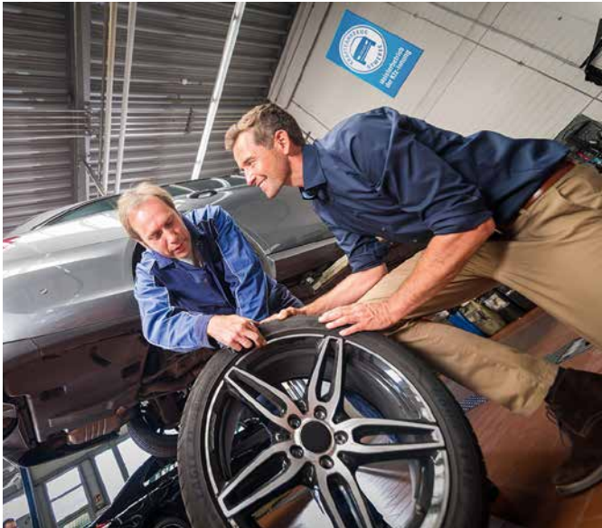
Kfz-Experten raten, ab Oktober Winterreifen aufs Auto zu montieren.

Milde Winter in unseren Breitengraden verleiten manche Autofahrer dazu, ihren Pkw das ganze Jahr über mit einem Satz Reifen zu bewegen. Doch Autoexperten des Deutschen Kraftfahrzeuggewerbes raten davon dringend ab – aus guten Gründen. Die spezielle Gummimischung von Winterreifen hat nicht nur auf Schnee und Eis, sondern auch auf trockener Fahrbahn bei niedrigen Plusgraden klare Vorteile, da ihre Gummimischung bei Temperaturen unter null flexibel bleibt. Ganzjahresreifen sind lediglich für Wenigfahrer eine sinnvolle Alternative. Ob vorhandene Winterreifen noch in verkehrssicherem Zustand sind, kann der Kfz-Meisterbetrieb überprüfen. Es lohnt sich, rechtzeitig einen Werkstatttermin zu vereinbaren, denn im Reifenwechselmonat Oktober ist der Andrang in den Kfz-Betrieben groß. djd