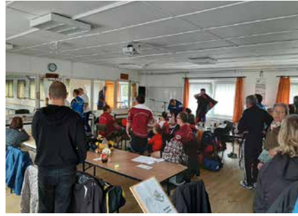
Auf der Kegelbahn war mächtig was los