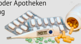
djd (Foto: djd/Sanofi)

Die Grippe kann für Menschen ab 60 Jahren besonders gefährlich werden: Sie haben ein deutlich höheres Risiko für einen schweren Verlauf und Folgeerkrankungen wie Herzinfarkte oder Schlaganfälle. Ein Grund dafür ist das altersbedingt schwächer arbeitende Immunsystem. So werden zum Beispiel weniger weiße Blutkörperchen gebildet, die wichtig für die Immunabwehr sind. Das kann dazu führen, dass Infektionen schwerer verlaufen und man länger braucht, um sich zu erholen. Der Gripeschutz ist daher für ältere Menschen besonders wichtig: Am besten einen Impftermin zwischen Oktober und Mitte Dezember vereinbaren. Auch später in der Grippezeit bis ins Frühjahr hinein ist die Impfung sinnvoll. Arztpraxen oder Apotheken informieren, welche Grippeimpfung die STIKO ab 60 Jahren empfiehlt.