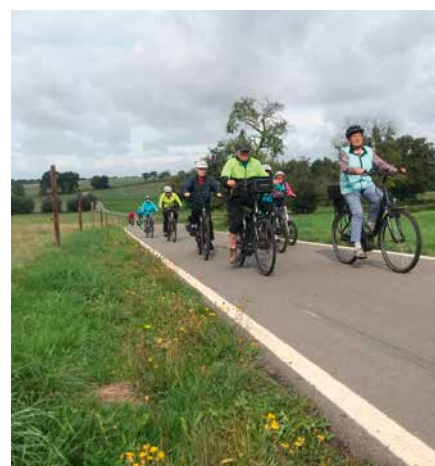
Auf der Mulde-Elbe-Radrouten vor Mutzschen

vorbei auf den regenfesten Radwegen an der S 38 nach Mutzschen und wieder am landschaftlich sehr reizvollen Mutzschener Wasser, durch Thümmnitz, Würschwitz und Schmorditz zum Mulderadweg nach Grimma mit Pause an der gut gefüllten Mulde. Ohne Regen und Panne erreichten alle auf der Alten Poststraße nach insgesamt ca. 70 km und ca. 570 Hm Naunhof.