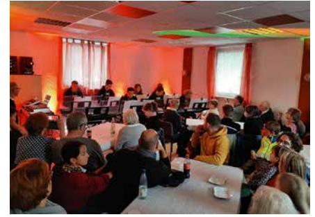
Livekonzert der Keyboardgruppe Melodie Life